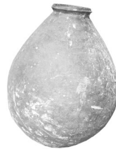
le pot à eau