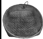
tsegele le tamis