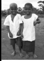
obhukosi les jumeaux