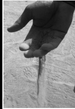
sike le sable